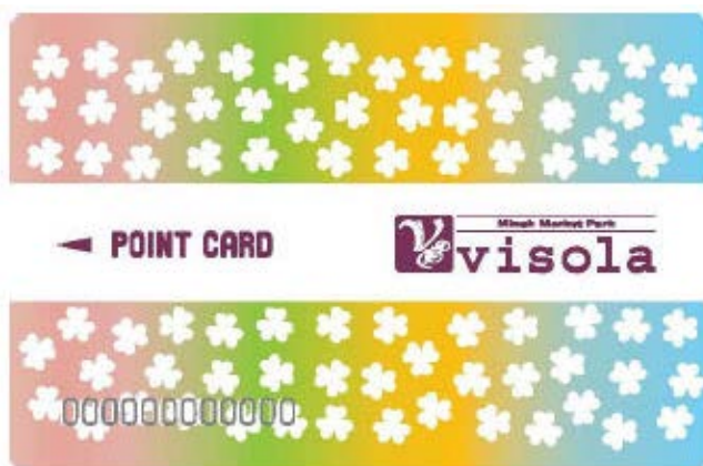
新デザイン「ヴィソラカード」

今後も、地域のお客様に利便性・楽しさを感じていただけるよう、サービスの向上に取り組みます。