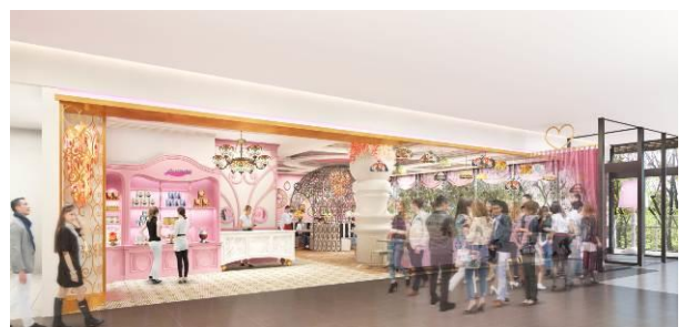
「Serendipity3 表参道」外観イメージ