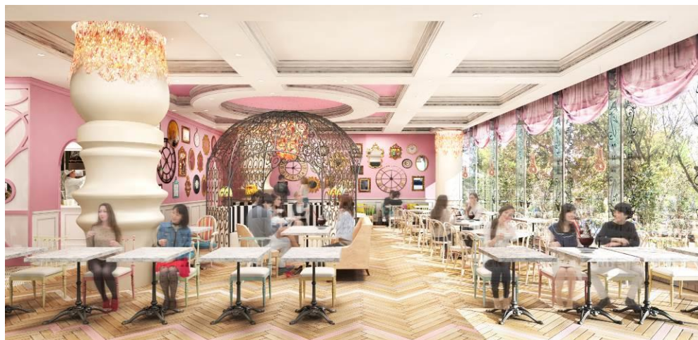
「Serendipity3 表参道」内観イメージ

東急不動産SCマネジメント株式会社(本社:東京都港区、社長:佐藤一志)が運営管理する「東急プラザ表参道原宿」に、2017年8月10日(木)、ニューヨーク マンハッタンで約60年に渡り世界中のセレブリティから愛されている至福のデザートカフェ「Serendipity3 (セレンディピティスリー)」が日本初出店することをお知らせします。