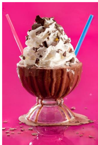
「Frrrozen Hot Chocolate」 (フローズン ホットチョコレート)