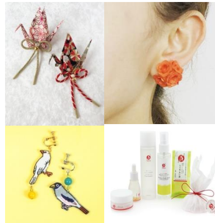
&lt;ワークショップ作品&gt;

東急プラザ銀座では、6階フロア全体に昔の江戸村をイメージした装飾を施し、「銀座たいけん村」と題して、粋な江戸の夏の雰囲気を感じながら、「ゆかたで銀ぶら」を更にお楽しみいただけるイベントを開催いたします。