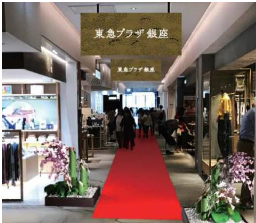
&lt;館内装飾イメージ&gt;

イベント期間中、東急プラザ銀座6・7階「FIND JAPAN MARKET」フロアでは、「和」をテーマにしたワークショップの開催や、ゆかたで来館いただいたお客様を対象としたサービスの実施など、東急プラザ銀座ならではの“和のおもてなし”を提供いたします。