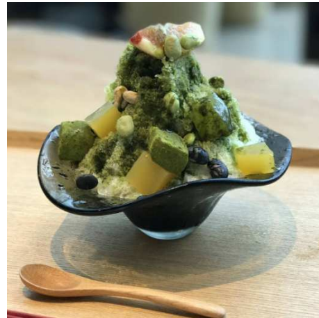
<オリジナルかき氷>

「THE GREEN Cafe American Express × 数寄屋橋茶房」は、東急プラザ銀座6階KIRIKO LOUNGE内のカフェラウンジ「数寄屋橋茶房」とアメリカン・エクスプレスのコラボレーションにより実現し、8月25日(金)～9月22日(金)の期間限定でオープンするカフェです。