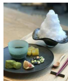
オリジナルかき氷