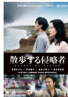
「映画『散歩する侵略者』メインビジュアル」

デックス東京ビーチはご家族連れ、カップル、観光客など多くの方にご来館いただき「大事な人と大切な時間を過ごす場」としてご利用いただいています。「世界は終わるのかもしれない。それでも、一緒に生きたい。」と謳う本映画作品のテーマと一致することからタイアップキャンペーンが決定しました。