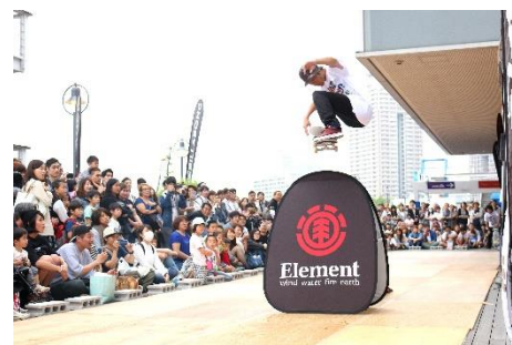
スケートボードショーの様子(イメージ)