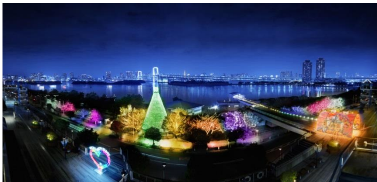
映画『レゴ®ニンジャゴー ザ・ムービー』とコラボレーションした期間限定演出イメージ

東京湾の美しい夜景と共に楽しめるデックス東京ビーチならではのイルミネーションで、印象的なハロウィンをお楽しみください。