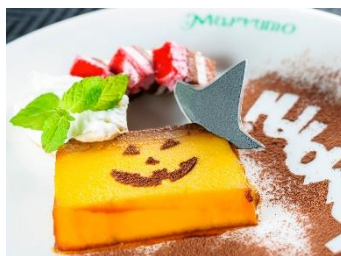
「かぼちゃのプリン」