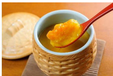
「かぼちゃの茶碗蒸し」

館内の12店舗で、ハロウィン限定メニューを展開します。インドの甘い手作りアイスクリームと、どこか懐かしく温かいかぼちゃのお菓子のコンビネーション「甘くてしあわせインドのよくばりスイーツ(カザーナ)」や、しょうゆ風味のあんかけがかぼちゃの甘味をひきたてる「かぼちゃの茶碗蒸し(築地玉寿司)」などが登場します。