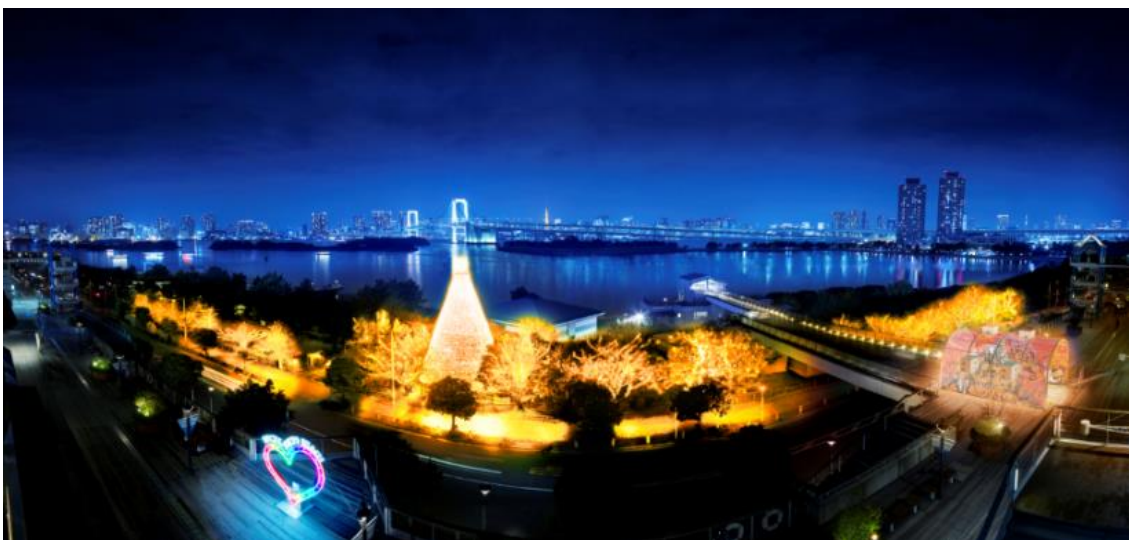
「樹木イルミネーション」イメージ

生木としては都内最大級の「台場メモリアルツリー」を中心にした全長約200mに渡る「樹木イルミネーション」では、期間中は約22万球の光がオレンジ色に輝いてハロウィンの雰囲気盛り上げます。人の動きを感知し映像に反映する屋外体感型イルミネーション「ILLUSION DOME(イリュージョンドーム)」内では、投影された映像に触れると、ハロウィンの象徴であるカボチャがランダムに回ったり、魔女がコミカルに踊りだしたりするギミック(仕掛け)を体験できます(9月29日(金)から開催)。ギミックはかわいらしい動きのため、お子さまも一緒に楽しむことができます。