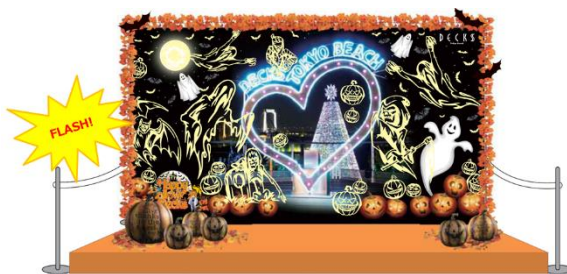
「ハロウィンおばけフォトスポット」イメージ

◆場 所: シーサイドモール3F デックス広場 シーサイドモール4F タワー広場