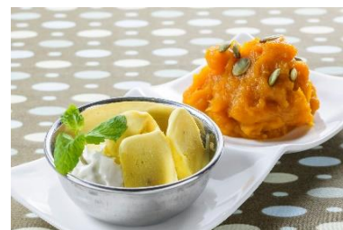
「甘くてしあわせ インドのよくばりスイーツ」