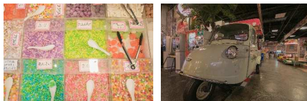
ノスタルジックかつフォトジェニックな館内

「台場一丁目商店街」は2002年10月にオープンし、今年で15周年を迎えます。東京タワーを模した「台場タワー」や高度成長期のシンボルである新幹線を模した「昭和ステーション」、駄菓子屋や懐かしいゲームセンターなどが並ぶ昭和の下町を再現し、国内外多くの方々にご来館いただいています。昭和を懐かしく思う世代のみならず、写真に映えるレトロな雰囲気は若年層にもフォトスポットとして人気があります。