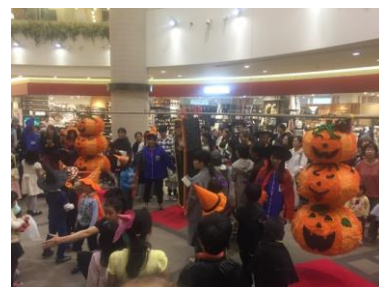
クラッシュイベント(2016年)