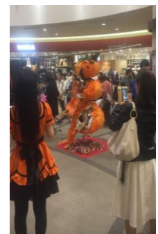
クラッシュイベント(2016年)