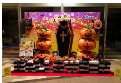
“特大ピニャータ”展示(2016年)