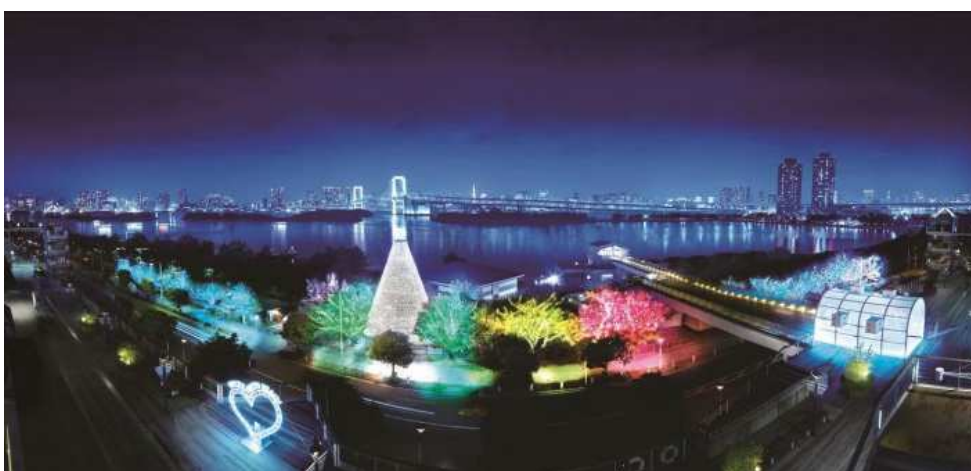
「お台場イルミネーション“YAKEI”」全体イメージ(中央が樹木イルミネーション)(イメージ)

高さ約20メートルの「台場メモリアルツリー」を中心にした全長約200メートルに渡る「樹木イルミネーション」は、約22万球の光が期間中にしか見られない演出で優しく染まります。