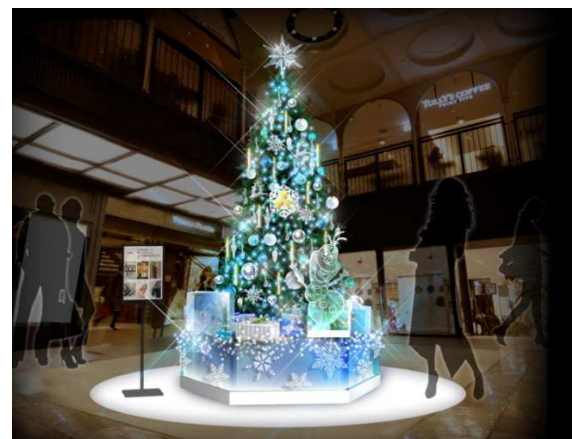
B2F エントランス / Ice Tree