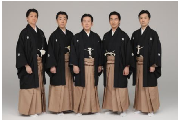
<五耀會(ごようかい)>

この度、「冬」のSPECIAL PROGRAMとして、日本舞踊の実力者5人からなる「五耀會(ごようかい)」による、「日本舞踊で迎えるお正月～初春一刻値千金(はつはるいっこくあたいせんきん)～」の開催が決定しましたので、お知らせいたします。