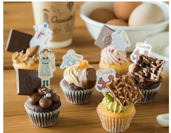
『CharLotte X KIRIKO LOUNGE』提供メニュー

『バレンタインマルシェ Produced by HINKA RINKA』は、東急プラザ銀座3階～5階に位置する、東急百貨店が発信する大人のセレクトストア「HINKA RINKA」がプロデュースをするバレンタインシーズン限定のマルシェです。NY発のチョコレート専門店「カカオ マーケット バイ マリベル」をはじめとした、国内外から厳選された5店舗が出店します。