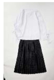
レディストータルコーデ

(レディス&メンズ／ファッション) 秋らしいブラウンカラーの中に、ホワイトパンツを取り入れることで、着こなしが華やかに。