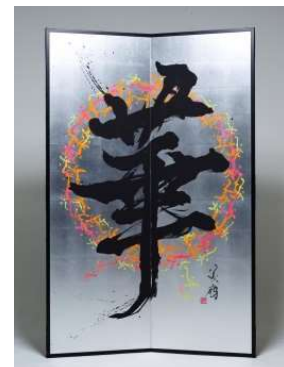
<オリジナル屏風「華」>

“うららか(麗らか)”とは、晴れ晴れとして楽しそうなさま、心にわだかまりのないさま、といった意味を持つ古語です。心地よい季節である初秋に、東急プラザ銀座では“うらかなモノたち”との出会いを通じて、何か新しいことを始めようというコンセプトのもと、各種キャンペーンやイベントを展開します。