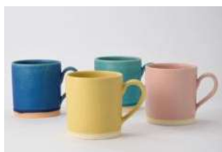
カラーマグカップ

毎年人気のボーダーロンパースに、見た目にも暖かいもこもこフリースジャケットを合わせました。子供らしいボンボン付のニットキャップがアクセントです。