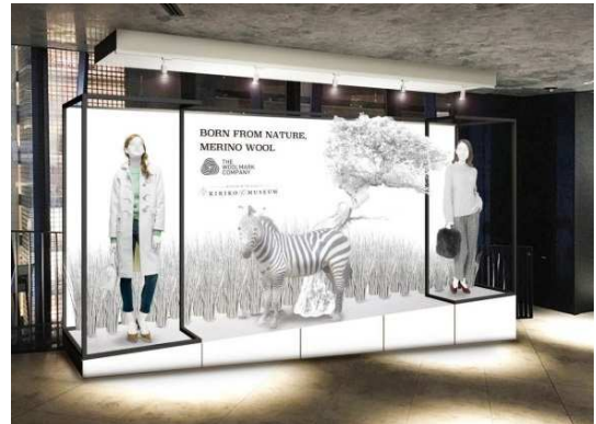
<6階 KIRIKO LOUNGE横>

“まめやか(忠実やか)”とは、心のこもった、かりそめでない、本格的なといった意味を持つ和語です。クリスマスシーズンを迎える季節に東急プラザ銀座では、“まめやか”なモノたちとの出会いを通じて、心のこもった“本物”と出逢うというコンセプトのもと、各種キャンペーンやイベントを展開します。