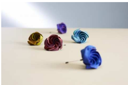
コサージュ 6,000円(税込)