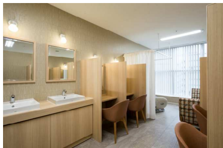
パウダールーム(女性従業員専用)