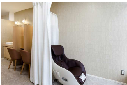
マッサージ機の設置(女性従業員専用)