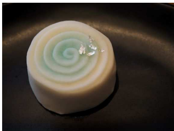
オリジナル納涼デザート「観世の水面」

プロジェクトの第一弾は、7月26日(金)～8月25日(日)までの期間、日本の夏の風物詩でもある浴衣を着て銀座で涼を楽しむ「ゆかたで銀ぶら」(主催:全銀座会、銀座通連合会)の連動施策として、東京藝術大学プロデュースによる「うるはし～日本の夏祭り」を開催します。