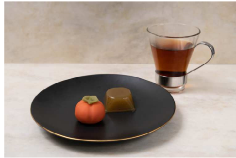
ドリンク付き 特別セットメニュー 1,200円(税込)