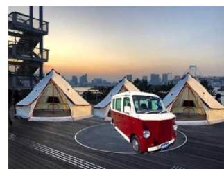
おでん BAR (イメージ)

期 間 : 2019年12月8日(日)、14日(土)、15日(日)、21日(土)、22日(日) 2019年12月28日(土)～2020年1月3日(金) 時 間 : 14:00～21:00 場 所 : デックス東京ビーチ 3階 シーサイドデッキ 内 容 : 「おでん BAR」のキッチンカーが登場。温かいフードを片手に、 グランピングタイプのテントで非日常空間が楽しめます。 ※12月14日(土)、21日(土) 19:30～21:00には、 手持ち花火イベントも同時開催。各日先着400名対象。