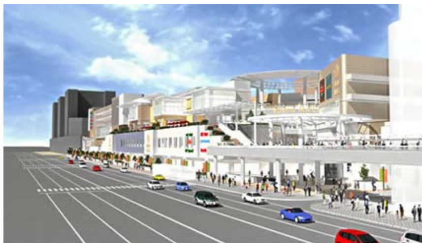
(仮称) 阿倍野プロジェクト施設概観完成予想図