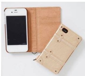
iPhone ケース (シンラクリエイション) ¥2,480(税込)