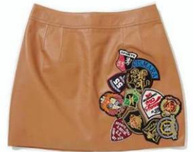
ワッペン付ラムスカート (ブラック/ブラウン) ¥23,000(税込)