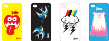
BEAMS オリジナル iPhone ケース

1976年より原宿のファッションを支え続けてきたセレクトショップ BEAMS と年間を通じた多角的なコラボレーションを展開する「東急プラザ 表参道原宿」。第2回目となる今秋は、5F『AppBank Store』限定の「The Wonderful! Design works.」デザインの BEAMS オリジナル iPhone ケースが登場します。