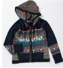
ニットカーディガン (free people) ¥15,540(税込)