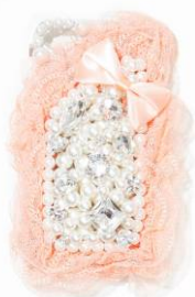
iPhone ケース ¥14,700(税込)