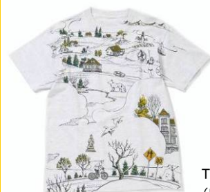
T シャツ (MORIOH TOWN) ¥6,000(税込)