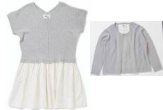
ワンピース (kuskus) ¥14,700(税込) セーター (kuskus) ¥11,550(税込)