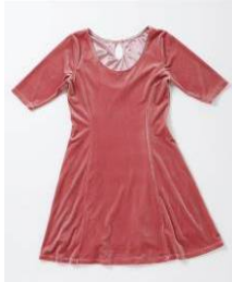
ベロアワンピース ¥6,930(税込)