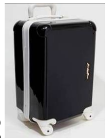
トローリーケース Sサイズ ¥19,950(税込) Mサイズ ¥22,050(税込)