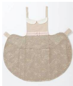
レースエプロン ¥3,465(税込)