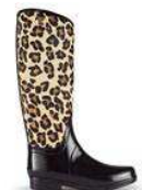
HUNTER OMOHARA STATION 限定モデル ¥29,400(税込)