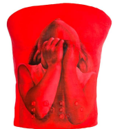
ブレスト・キャスト(胸型) Roy Nachum/北島康介