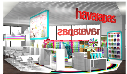
havaianas SHOP イメージパース▲