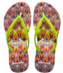
MISSONI Loves havaianas 2012 Collection ▲