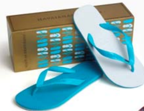
▲havaianas 50 anniversary モデル