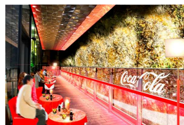
「Happy Lounge presented by Coca-Cola」 ※画像はイメージです

Coca-Cola | OMOHARA Cafe Happy Lounge by Coca-Cola