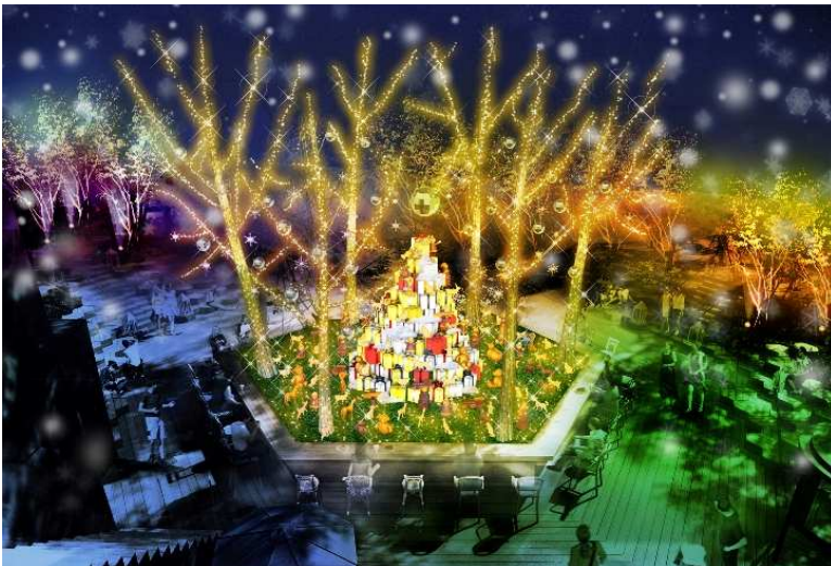
「おもはらの森」クリスマスイルミネーション【Gift～森からの贈り物～】

このたび、6階「おもはらの森」で展開するイルミネーションの詳細や各ショップのクリスマスおすすめアイテム、豪華プレゼントが当たるキャンペーンの内容が決定しましたのでお知らせ致します。