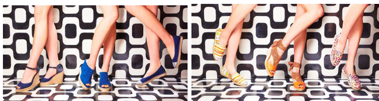
「セルベーラ」商品イメージ 価格帯： 本体価格7,000円～15,000円＋税