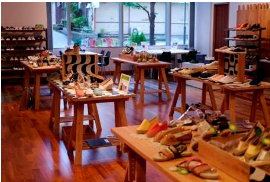
「バタフライツイスト」(左)／「セルベーラ」(右)ショップイメージ ※画像は他店舗のものです

東急不動産 SC マネジメント株式会社(本社:東京都渋谷区、社長:土屋光夫)が運営管理する「東急プラザ 表参道原宿」の旬なモノ・コトを発信する3階のポップアップスペース「OMOHARA STATION」に、ロンドン発のパッカブルシューズ「BUTTERFLY TWISTS(バタフライツイスト)」と、ブラジル発のエスパドリュージュ「CERVERA(セルベーラ)」という、夏の足元のおしゃれを彩る海外発の2ブランドのオンリーショップを、2014年8月18日(月)から9月4日(木)までの期間限定でオープンすることをお知らせ致します。