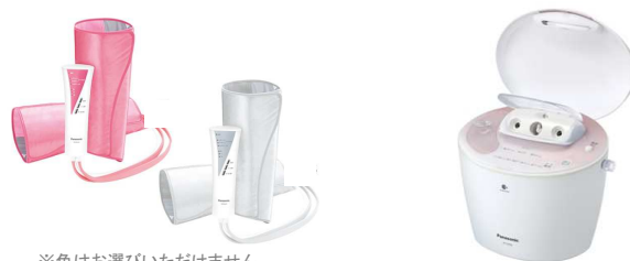
※色はお選びいただけません