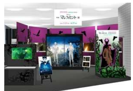
In Celebration of Disney's "Maleficent" LOVE & CHARM in OMOHARA 特別企画