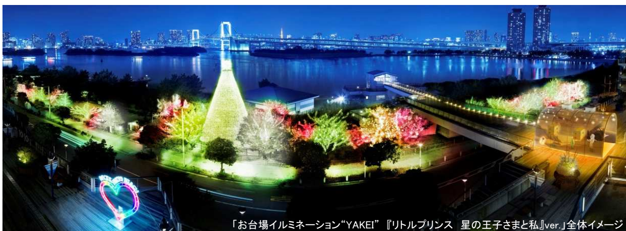
「お台場イルミネーション“YAKEI”『リトルプリンス 星の王子さまと私』ver.」全体イメージ

東急不動産SCマネジメント株式会社(本社:東京都港区、社長:土屋 光夫)が運営管理する東京・お台場の商業施設「デックス東京ビーチ」は、「お台場イルミネーション“YAKEI”」の点灯開始1周年を記念し、名作「星の王子さま」の公式続編映画とコラボレーションした「お台場イルミネーション“YAKEI”『リトルプリンス 星の王子さまと私』ver.」を、2015年11月16日(月)から2016年1月31日(日)まで実施します。