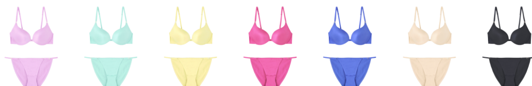
CANDY FIT BRA 7 色 5,900 円 (税抜) ショーツ or T バックセット