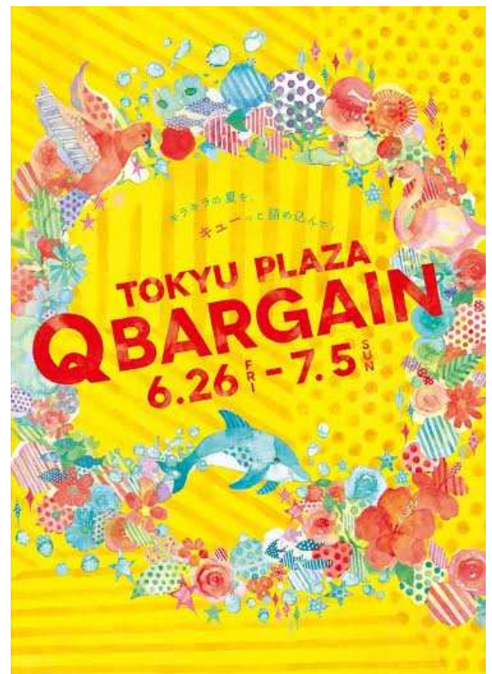
TOKYU PLAZA Q BARGAIN メインビジュアル (※表参道原宿は7月12日まで開催)