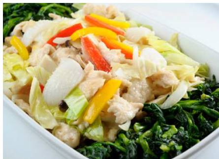
「鶏肉とイカの炒め春野菜合わせ」 価格:お一人様2,000円(税込) ※夕食バイキングメニューに含む 店舗名:太陽樓