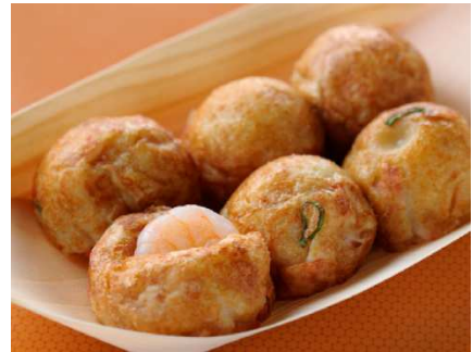
「エビマヨ焼き」 価格:6個600円(税込) 店舗名:芋蛸