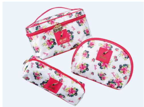
「Barbie ポーチ各種」 (左上)価格:4,320円(税込) (左下)価格:2,376円(税込) (右)価格:3,024円(税込) 店舗名:イーマーベラス