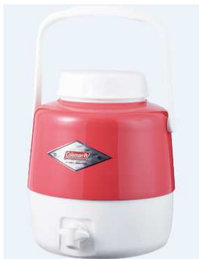
「コールマン スチールベルトジャグ」 価格:9,180円(税込) 店舗名:WILD-1

お花見やバーベキューに活躍しそうな、見た目も可愛い給水容器「コールマン スチールベルトジャグ」、ベビーカーの老舗ブランドとのコラボレーションで、軽量コンパクトでも快適な走り心地を実現したペット専用カート「Combi × DOGDEPTコラボカート」、春らしい花柄があしらわれたメイドインジャパンの高機能ポーチ「Barbie ポーチ(全3種)」などが登場します。