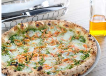
「桜海老と菜の花のジェノベーゼ」 価格:1,814円(税込) 期間:3月1日(火)~4月21日(木)