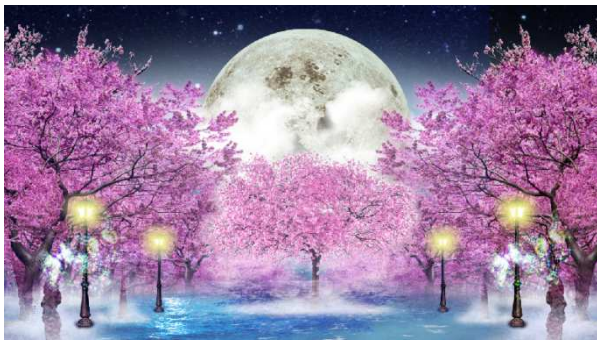
左側壁面イメージ: 夜桜と月光