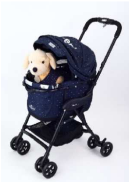
「Combi × DOGDEPTコラボカート」 価格:58,320円(税込) 店舗名:DOG DEPT+CAFE