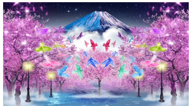
左側壁面イメージ: 夜桜と富士山