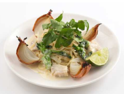
「チキンと菜の花のアルフレッドソースパスタ」 価格: 1,320円(税込) 期間: 3月11日(金)～4月21日(木)