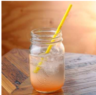
「自家製いちご酵素ソーダ」 価格:500(税込) 店舗名:IKAYAKI STAND

春限定メニューとして、オリジナルのいちご酵素を使用した「自家製いちごの酵素ソーダ」、あっさり塩味で炒め、菜の花・芽キャベツを添えた「鶏肉とイカの炒め春野菜合わせ」、お客様からのリクエスト数NO1、タコの代わりに海老を1尾とマヨネーズが入れた「エビマヨ焼き」などが登場します。