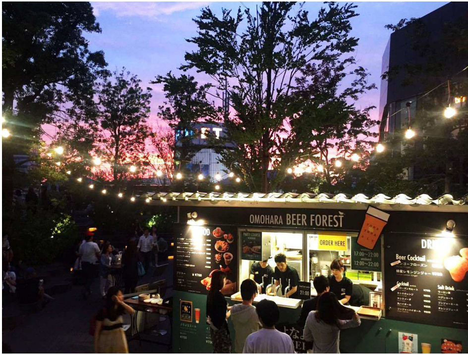
「OMOHARA BEER FOREST by YONA YONA BEER WORKS」イメージ ※写真は2015年開催時の様子。

6階屋上テラス「おもはらの森」にて夏季限定で開催 2016年6月24日(金)～9月4日(日)