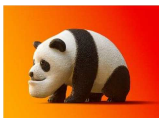
「シャクレルプラネット」 シャクレルパンダ