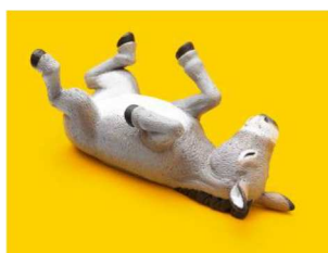
「ZooZooZoo もうしら寝」 ロバ