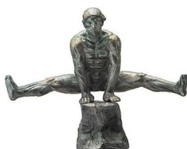
「考えない人」 考えないで開脚する人