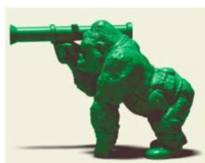
「GREEN GREEN ARMY」 ゴリラ