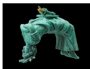
「自由すぎる女神」 自由すぎてブリッジする女神