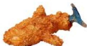
「サメフライ」 ジンベエザメフライ