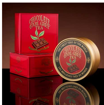
<Chocolate Earl Grey> (TWG Tea)

今年のバレンタインは、東急プラザ銀座の洗練されたメニューを、大切な人に贈ってみてはいかがでしょうか。