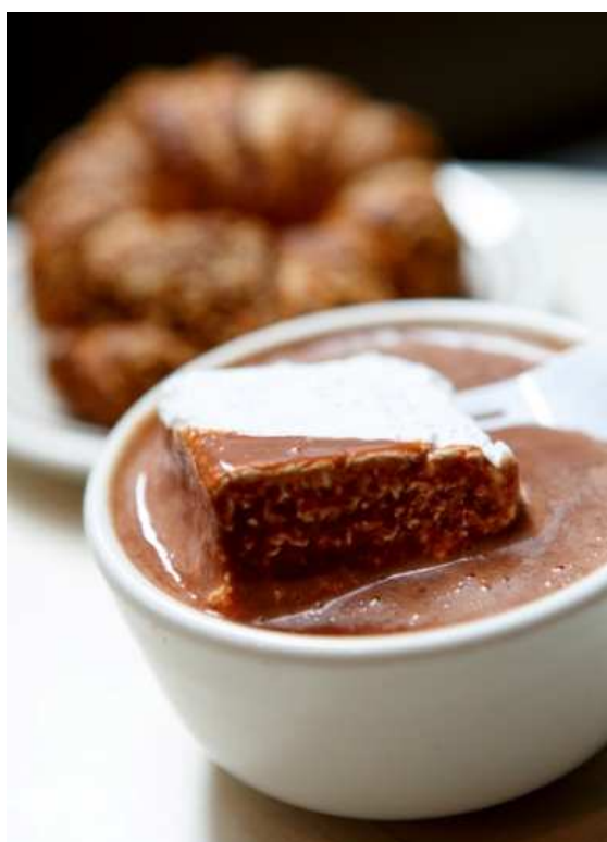
<ホットチョコレート> (THE CITY BAKERY)