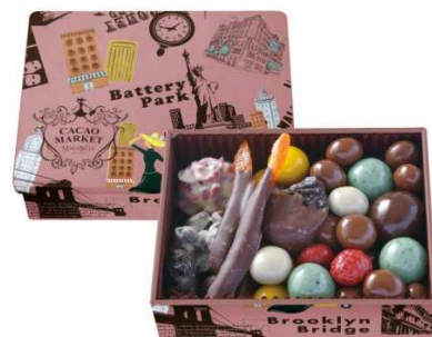
<チョコレートボール&ドライフルーツチョコレートディップ Pinkアソートボックス> (Cacao Market by MARIEBELLE)