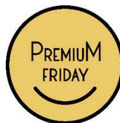
<プレミアムフライデー ロゴマーク>