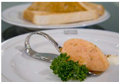
<CAVIAR HOUSE & PRUNIER ／SANDWICH HOUSE>