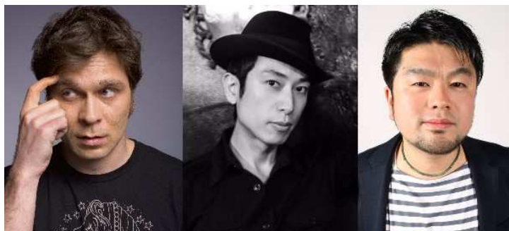
<スペシャルDJイベント 出演者>

当施設のほか、銀座三越、松屋銀座をはじめとする銀座エリアの施設でも、「プレミアムフライデー」限定の企画やサービスを実施予定です。複数施設の賛同により、月末金曜日の銀座エリアを盛り上げてまいります。