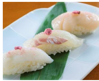
「桜塩を使った握り3貫」 価格:642円(税込) 店舗名:築地玉寿司 ※食べ放題不可