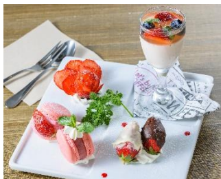
「贅沢イチゴのマカロン添え」 価格:843円(税込) 店舗名:Trattoria Pizzeria LOGIC

デックス東京ビーチ内のレストランやカフェ28店舗では、イベント期間限定の、春に家族みんなで食べたいおすすめメニューを展開します。