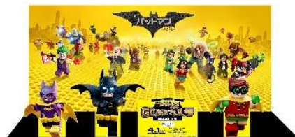
フォトスポットイメージ