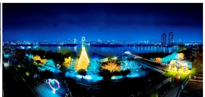
左上:「イリュージョンドーム」、右上:「お台場イルミネーション“YAKEI”」全体イメージ(左下が『ハートのオブジェ』、中央が『樹木イルミネーション』)、下「ハートのオブジェ」(全てイメージ)