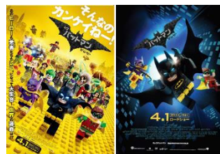
ノベルティカードイメージ