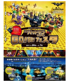
イベントキービジュアル

フォトスポットとして人気の「ハートのオブジェ」も、キャラクターの装飾を施して「レゴ®バットマン ザ・ムービー」仕様になり、一日中撮影を楽しめます。ボタンを押すと音が流れる演出は終日実施され、19:00以降は樹木イルミネーションとも連動します。