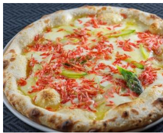
「桜エビとアスパラ春のピッツァ」 価格:1,200円(税込) 店舗名:トラットリアマルーモ