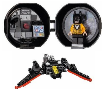
景品 上:バットマン バトルポッドミニフィギュア、 下:バットウイング<ミニセット>