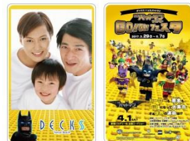
#SnSnapカードイメージ 左:表、右:裏