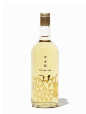
米焼酎 25度 酒造名：房の霧 商品名：黄金郷