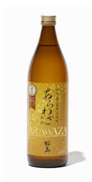
芋焼酎 25度 酒造名：本坊酒造 商品名：あらわざ桜島