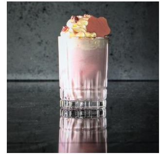
さくらラテ（ノンアルコール） 1,000円（税込）