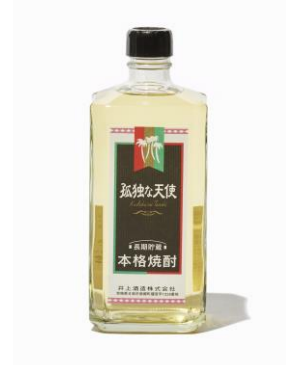
デーツ焼酎 36度 酒造名：井上酒造 商品名：孤独な天使