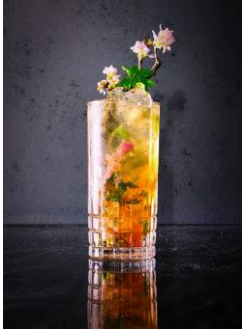
桜モヒート 1,980円（税込）