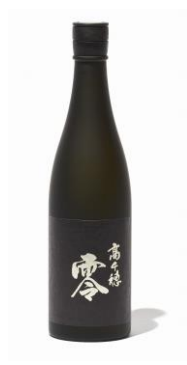
麦焼酎 25度 酒造名：高千穂酒造 商品名：高千穂 零