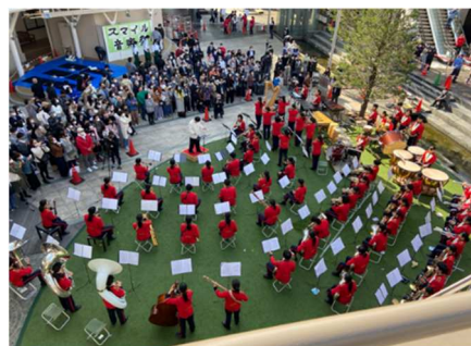
「みのおでみる！秋のスマイル音楽祭」開催の様子

キューズモールでは、施設のある地域を中心に、笑顔を生み出し、笑顔を広げていく社会貢献活動「スマイルプロジェクト」を実施しています。その一環でみのおキューズモールでは、昨年11月に「みのおでみる！秋のスマイル音楽祭」と銘打ち、コロナ禍で発表の場を失ってしまった地元の中学校・高校の吹奏楽部や地域の団体の皆様に発表の場を提供することで、地域の皆様の笑顔を生み出しました。