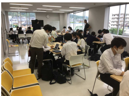
生徒たちの準備の様子

内容：箕面自由学園高等学校の生徒が企画したイベントで、当日の運営も生徒たちで担当します。キューズステージ付近では、全国大会で5度の金賞に輝いた箕面自由学園高等学校吹奏楽部「ゴールデンベアーズ」の演奏や「チアリーディング JAPAN CUP2021」で優勝した箕面自由学園中学校のチアリーダー部「ジュニアベアーズ」のパフォーマンス、地元「さくらい祭りの会」による神楽の演舞を繰り広げます。また地元の産品やキューズモールオリジナルグッズが当たるビンゴ大会も実施します。会場内では、クイズに答えながら館内各所をめぐるクイズラリーやスペシャルフォトスポットの設置、ストラックアウトや綿菓子などの露店の出店もあり、「出張食堂」では箕面自由学園高等学校の人気学食メニューを味わえます。