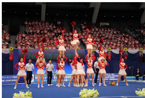
箕面自由学園中学校「ジュニアベアーズ」