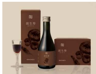
ニホンドウ漢方ブティック