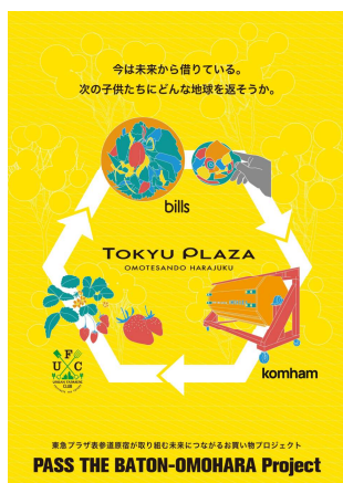
PASS THE BATON-OMOHARA