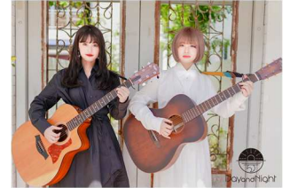
Day and Night