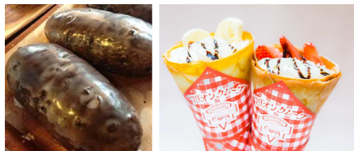
「屋上 Fair マルシェ」販売商品イメージ

大田区発祥とされる揚げパンに、学生たちのアイデアでSDGsの視点を取り入れ開発された、フェアトレードチョコレートを使用した新しいメニュー「フェアトレードチョコのあげぱん」や「フェアトレードチョコのクレープ」などを販売します。